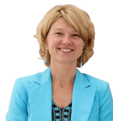
ЛУТ Оксана Николаевна

Министр сельского хозяйства Российской Федерации