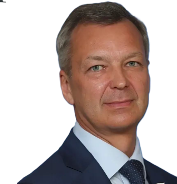
ЯЦКИН Андрей Владимирович

Первый заместитель Председателя Совета Федерации