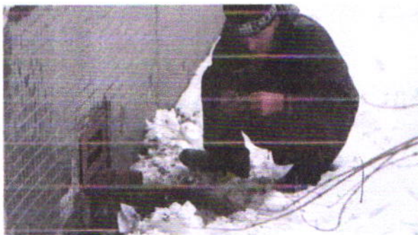
фото потребителям наркотиков.

Изобретательные продавцы прячут свой товар или «закладки» в общественных местах, дворах многоквартирных домов в клубах, детских песочницах. В зимнее время часто используют подъезды и лестничные площадки и многоэтажных домов – прячут «закладки» под периллами и откосами подоконников, наличниках, кабель – каналах, электрошитах и горшках с цветами.